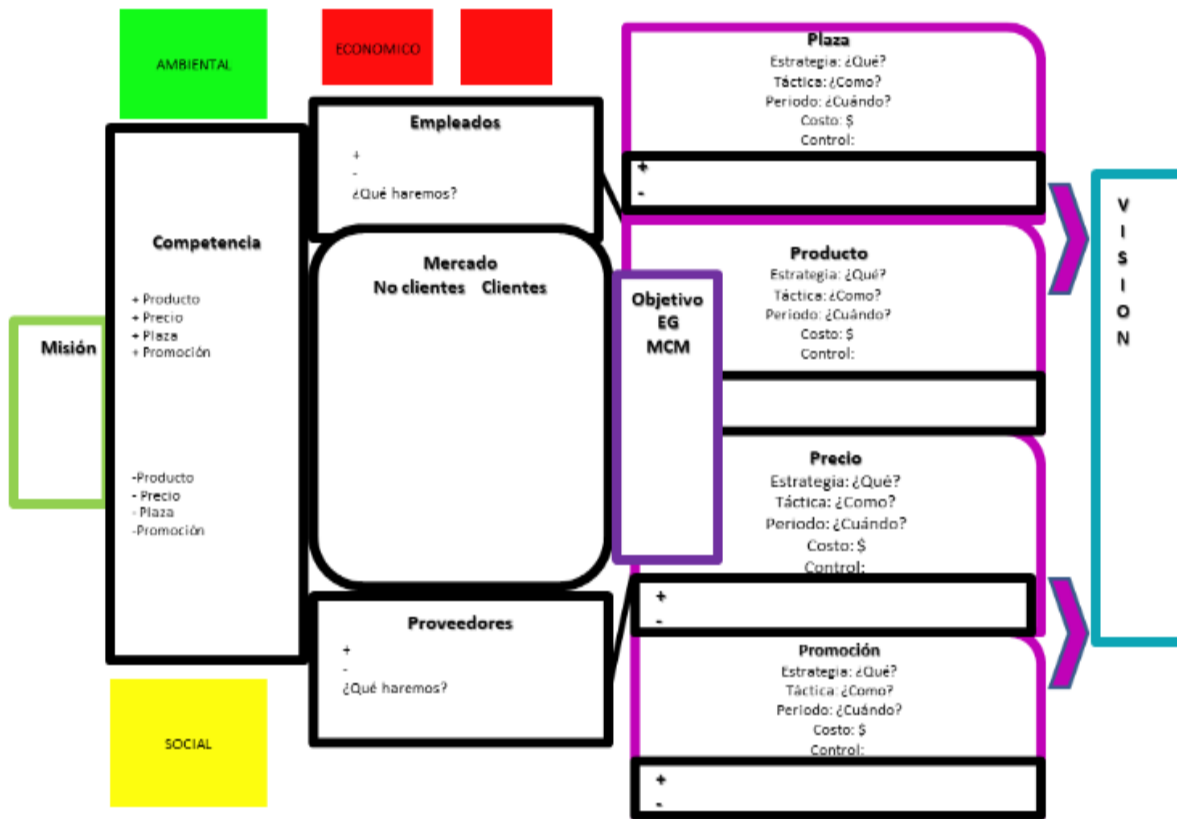
Figura 3. Diseño de la lámina.

corresponde al ¿Cómo lo haremos? tomado del proceso de planeación estratégica de mercadotecnia de Kotler (2000), Hernández, et al. , (2000), Rivero (2000) y Muñiz (2005); la quinta área corresponde al ¿Cómo lo medimos? tomado del proceso de planeación estratégica de mercadotecnia de Kotler (2000), Hernández, et al. , (2000), Rivero (2000) y Muñiz (2005) y la sexta área corresponde a ¿A qué aspiramos? La lámina y su diseño